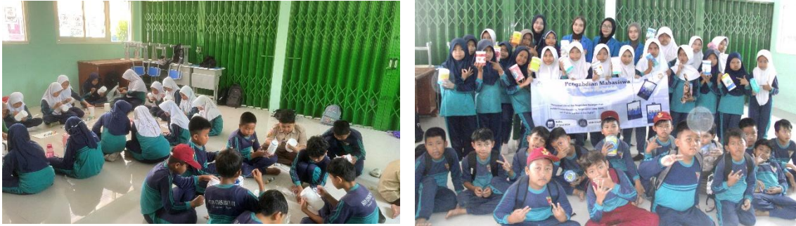
Gambar 1. Kegiatan PKM bersama siswa

Secara keseluruhan, kegiatan ini berhasil meningkatkan pengetahuan, kesadaran, dan pemahaman siswa mengenai pengelolaan keuangan sederhana serta pentingnya menjaga lingkungan sejak usia dini.